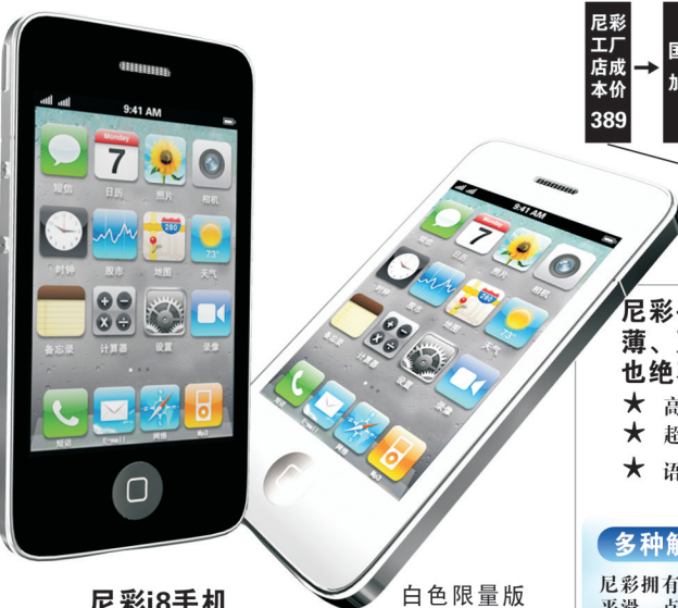
尼彩i8手机 白色限量版 新到50台