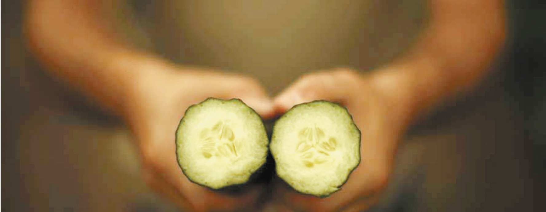
5月29日,在西班牙马拉加省阿尔加罗沃的一处温室,一名农民手持两截黄瓜。

近来,由于“毒黄瓜”引发的溶血性尿毒综合征在欧洲一些国家爆发。截至28日,德国确认276例感染病例,为欧洲最多,至少10名德国人死亡。另外,欧洲多国受到影响。