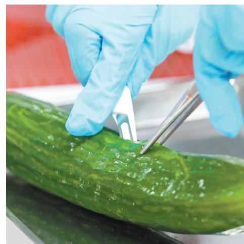
德国生物学家解剖一根黄瓜