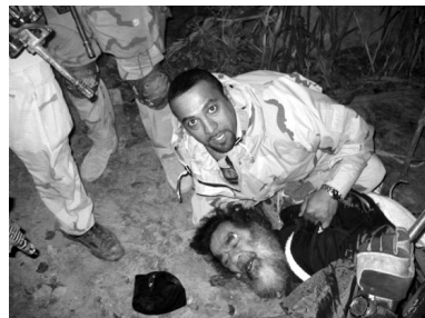
萨达姆被抓时候图片