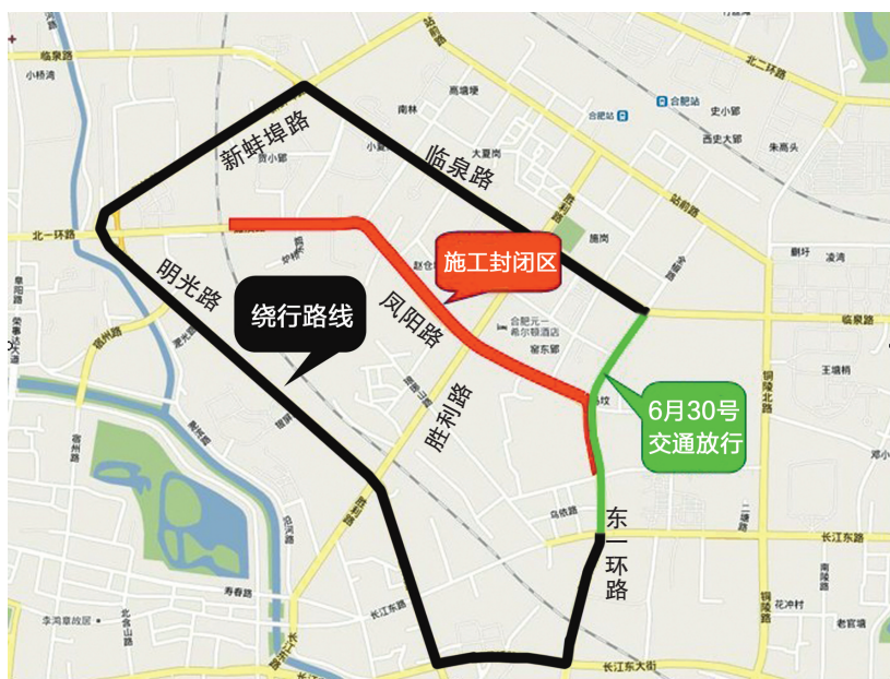
施工区域及绕行路线示意图

一环路与胜利路交口封闭 胜利路至淮南铁路段封闭 敬亭山路至临淮路段放行 18条公交线路将调整