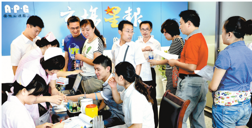
连日来,安徽出版集团组织开展了员工无偿献血活动,以此向党的90华诞献礼,集团各单位员工积极响应,数百名员工参与了此次无偿献血。昨日在本报门口,普兰德、省中旅以及本报等六家单位员工参与了献血。

党组书记、厅长纪冰要求全体党员要牢记党的宗旨、心系人民群众,始终坚持以人为本、执政为民,全心全意为人民服务;要严守党的纪律、加强廉洁自律,自觉维护水利行业的良好形象。