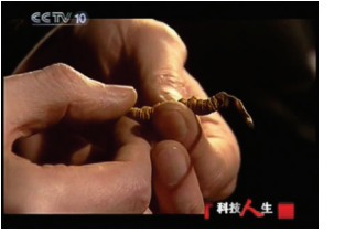
央视报道:冬虫夏草“新吃法”

专家媒体呼吁,有经济条件的三大类病患应该及早服用冬虫夏草,预防高死亡率和致残率的发生。