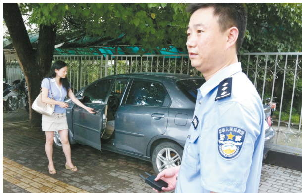
民警演示利用干扰器作案的过程

日前,合肥市公安局包河刑警一队成功破获一宗利用汽车干扰器盗窃车内财物的系列盗窃案件,案值近10万元。监控录像上完整记录了犯罪分子的作案全过程。