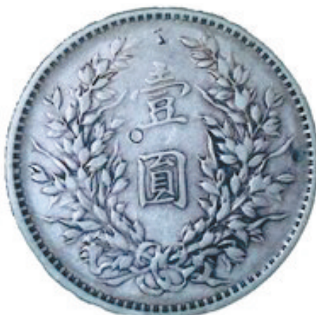
银元“壹”字左下角有戳记“O”