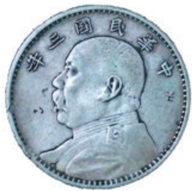
银元“中”字下角有戳记倒置的“工人”二字

这是一枚有纪念意义的银元,广义理解是纪念党的生日,狭义理解可能是庆祝根据地某一会战、会师的大胜利,或某重要会议的召开、重要机构的建立,最有可能是广义、狭义两种含意兼而有之。根据历史判断,这枚纪念币的铸造时间应在1928年7月1日之前的“全盛时期”。井冈山根据地1928年只有一个上井造币厂,因此,“七一工人”戳记银元也只能是上井造币厂所铸,非它莫属。