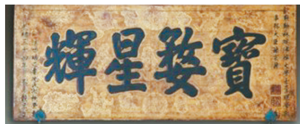
孙家鼐题匾“宝婺星辉”

这三枚银元在我省的发现,为井冈山根据地货币史的研究,尤其是对上井造币厂的研究提供了不可多得的宝贵资料。