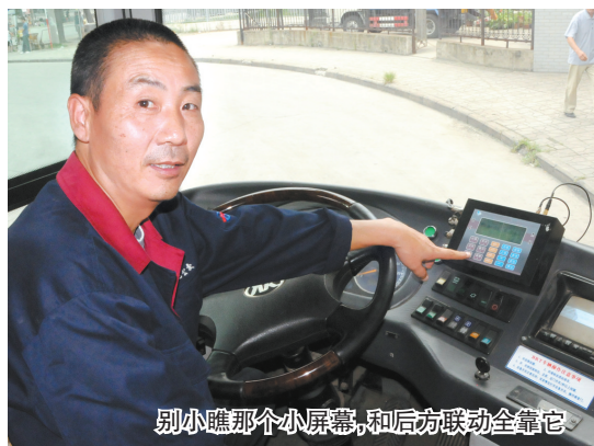
别小瞧那个小屏幕，和后方联动全靠它

自己等的那班公交车到了哪个位置？还要等多久？车上挤不挤？等车时，你只要看一眼电子站牌，这些疑问将迎刃而解。今年底，咱合肥的公交车有望全部实现智能化，近日3路公交车已经尝鲜。合肥公交集团就此昨日特别召开媒体座谈会，首次揭开了智能公交项目的神秘面纱！