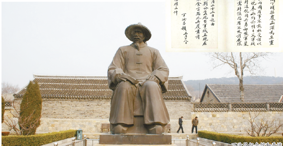
丁汝昌纪念馆和手迹

中国近代海军是皖人李鸿章组建而成，而第一位海军舰队司令是皖人丁汝昌。出生贫寒，从小成为孤儿的丁汝昌怎样走上中国近代海军最高指挥位置呢？