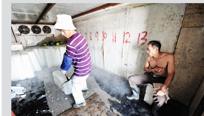
一名工人正在冷库中搬运冰块

到了下午6点多, 他们稍有点时间休息, 便把厚厚的衣服脱掉, 围在一起聊天, 说着家里大大小小的琐事。看到这里, 记者心里也有了一丝感动。也许, 这种另类的工作将会一直持续下去, 也将会一直有他们的存在。在这个夏天, 棉衣与冻疮谱写着另类人生。