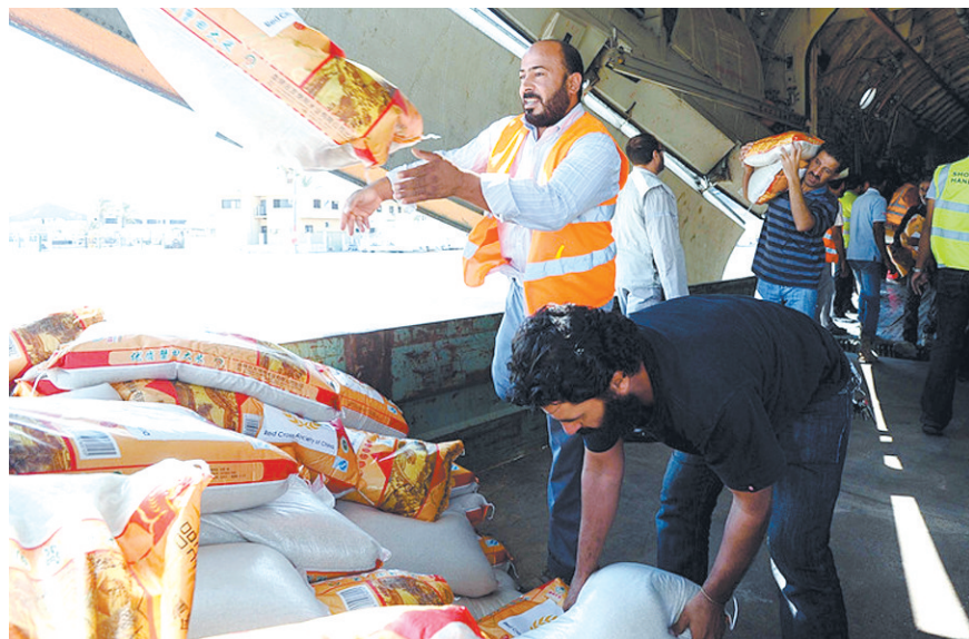
中国红十字会首批救援物资抵达利比亚,工人们从飞机上卸载救援物资。

阿拉伯国家联盟(阿盟)20日说,阿盟将于21日举行常驻代表紧急会议讨论加沙地带局势。