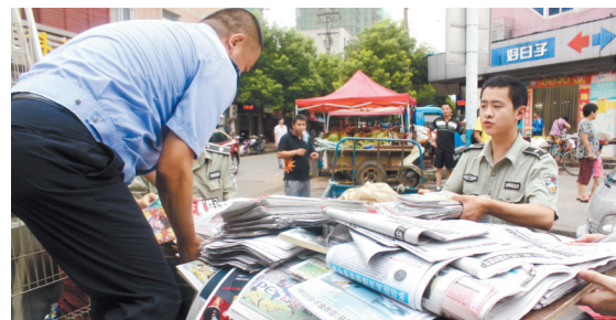
近日,合肥蜀山区城管执法大队对辖区近30个书报亭开展集中规范引导,并对部分存在占道经营的书报亭进行了查处。 李睿 记者 祁琳/文 李超钰/图