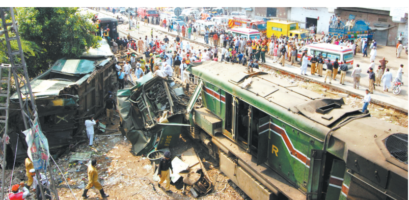
据巴基斯坦媒体30日报道,巴东部城市拉合尔当天上午发生一起火车相撞事故,造成至少5人死亡、25人受伤。图为人们聚集在发生相撞事故的火车残骸周围。新华社发

美国政府官员去年10月承认,类似实验在美国国内曾发生十余起。不过,美国媒体查阅医学杂志文章和剪报资料后认定,涉及美国公民的研究实验数量超过40起,主要进行于上世纪40年代至60年代。这些实验项目包括在康涅狄格州使精神病患者感染肝炎病毒、在马里兰州让囚犯吸入流感病毒、在纽约市一家医院向慢性病患者注射癌细胞等等,其中一些实验只是为满足好奇心,没有取得实际成果。