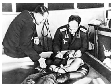
德国纳粹空军测试人体抵抗低温的极限

美国总统奥巴马任命的一个调查委员会8月29日说,美国政府研究人员上世纪40年代在明知违反伦理道德的情况下,对危地马拉1000多名在押人员和精神病患者实施性病人体实验,至少致死83人。除了美国,还有德国和日本进行过泯灭人性的人体实验。