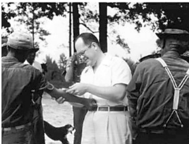
美国医生为“病人”注射