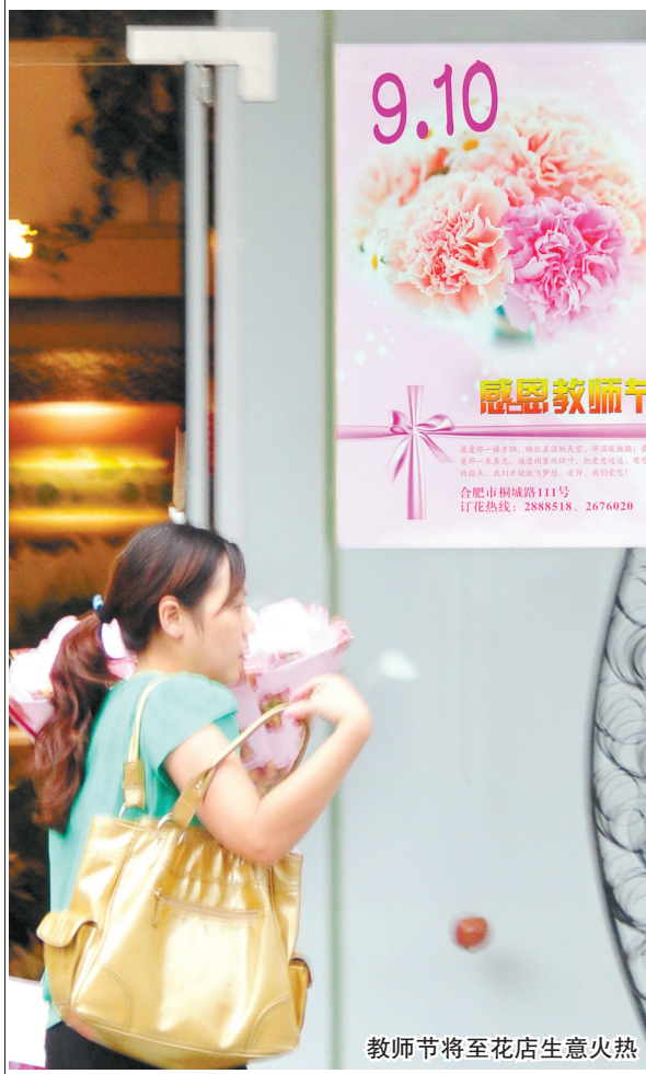
教师节将至花店生意火热

9月10日教师节,一个关于“要不要给老师送礼,送什么礼”的问题又如约而至,成为许多学生家长的“心病”。近日,就“教师节送礼”话题记者随机抽样调查了省城7所学校(包括幼儿园、小学、中学、大学)的92位学生和108位家长。调查结果显示,67%的家长反对教师节送礼行为,但他们当中82.4%的家长又都有过送礼经历,而接受调查的99%的学生表示,都曾在教师节当天给老师准备一份礼物。