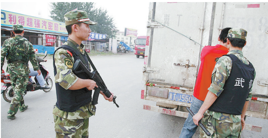
荷枪实弹的武警设卡对来往车辆进行清查

昨天上午,河北省深州监狱通报,9月11日早晨6点15分,该监狱一名罪犯越狱逃脱。事件发生过程中,没有出现人员伤亡。目前,河北警方已经发布通缉令,悬赏10万元追捕该名河南籍逃犯。