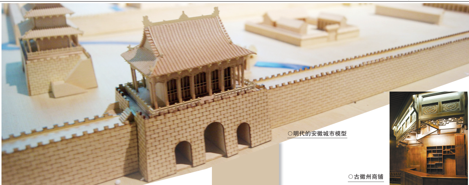
○明代的安徽城市模型