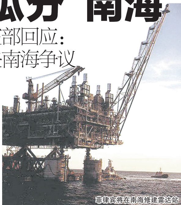
菲律宾将在南海修建雷达站