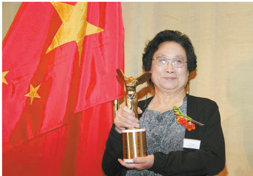
屠呦呦获得拉斯克奖

美国主流媒体纷纷对屠呦呦的研究成果予以高度评价。《纽约时报》援引世界卫生组织的评论说,这种药物是消灭这种疾病