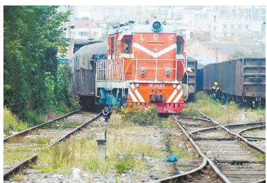
每天仍有列车驶过

皖能大厦 迎国庆,特价酬宾 标准间260元/间天 欢迎新老客户光临! 订房:2225056 2225057 会议:2225189 地址:合肥市马鞍山中路99号