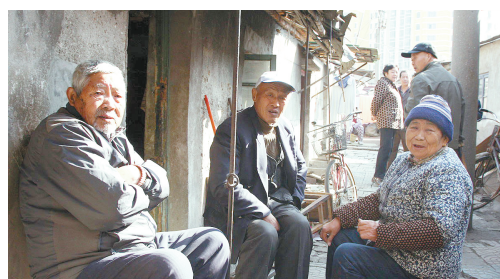
最后几户居民也要准备离开了