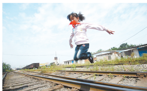
废弃的铁轨是孩子们喜爱的嬉戏场所