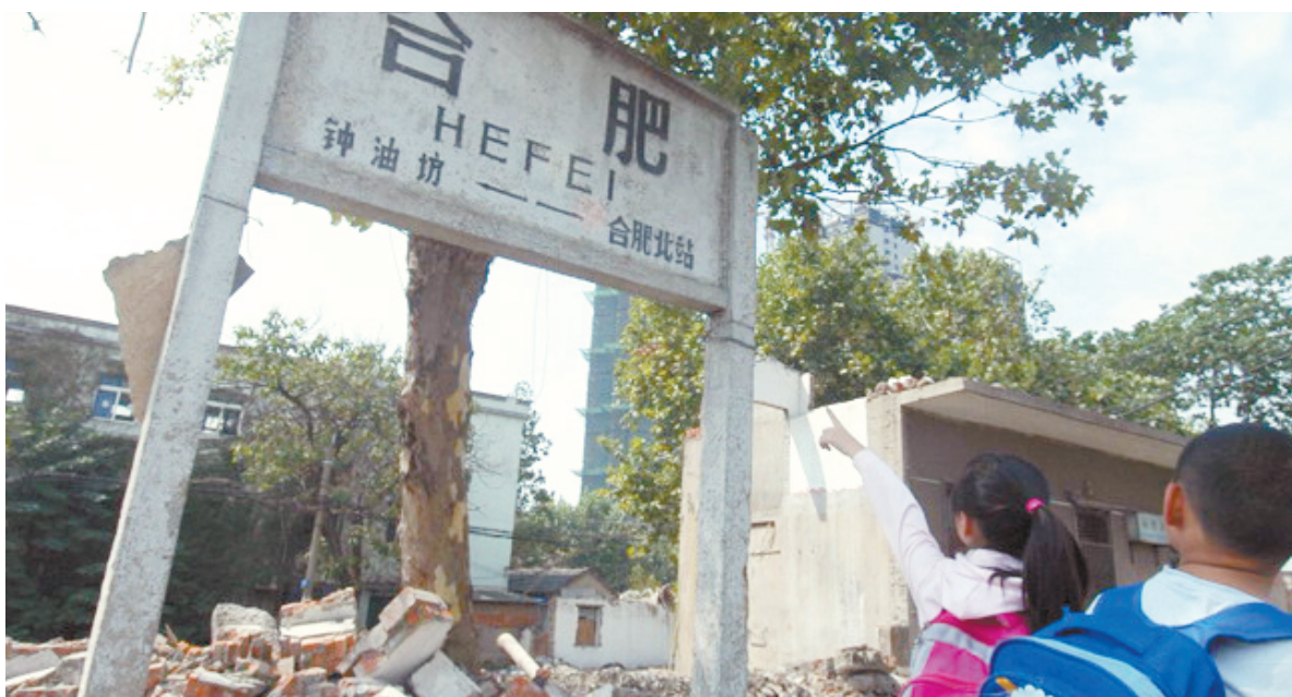
如今这里荒草丛生没有了鲜花