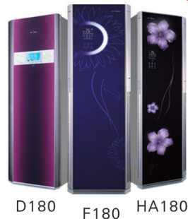
D180 F180 HA180