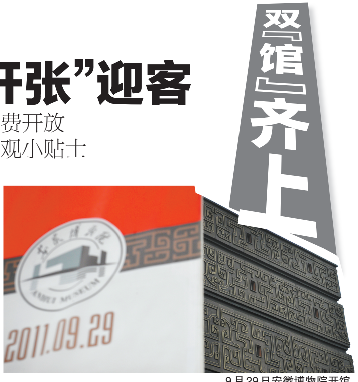
9月29日安徽博物院开馆

9月29日9点29分,吉时。位于省城政务区文博园的这个“大青铜鼎”,终于在此刻揭开了神秘面纱。昨天中午12时起,省博物馆新馆正式对公众免费开放。开馆当天,记者也有幸作为第一批观众,抢先领略新馆的风采。