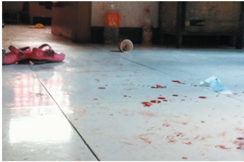
事发现场,屋内遍地血迹

现场屋里有明显打斗的痕迹,地上溅满了大量血迹,其中里屋的血迹让人尤为惊恐:“是拿租户家的菜刀行凶的,菜刀和剩余的农药瓶都被警方一并带走了。”