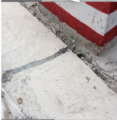
施工方用柏油修补该处断裂的路面