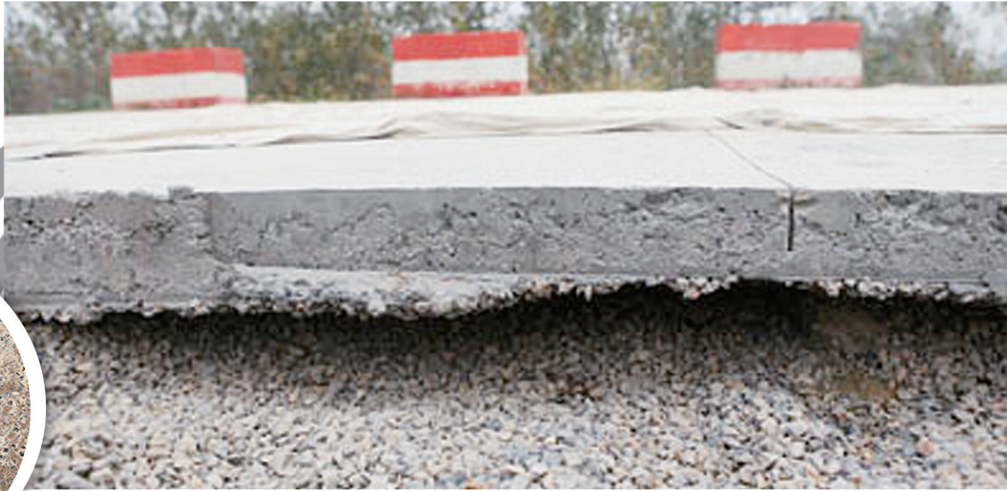
修补前:水泥路下面是空的