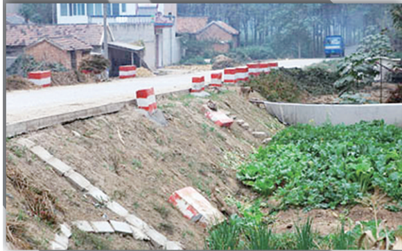
修补前,水泥护墩纷纷脱落