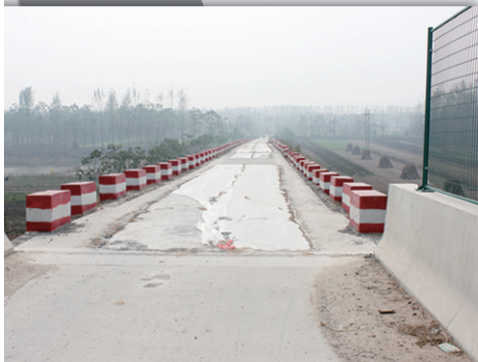
11月2日,路面被修补后的补丁