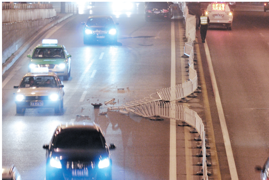
被撞倒的护栏横在马路中央

接下来，对面车道上一幕幕就有些惊心动魄了，司机们各显车技躲避护栏，其中一辆面包车不慎中招，撞上护栏，两前轮爆胎。