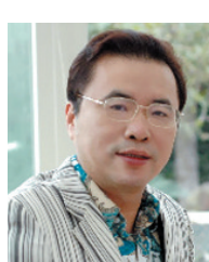
朱大鸣 著名财经评论人、企业家

中国人今年在投资上赚到钱了吗? 回答几乎是No! 人们在年初以为,调控房地产,股市总会有机会,因为股市与楼市是一对跷跷板。然而一切都乱套了,房价没怎么跌,股市却跌了30%。15日上证指数已跌到2180点,老百姓财富大大缩水,没有买房更买不起房子,这是宏观调控的成效吗?