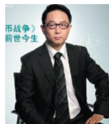
宋鸿兵 《货币战争》作者

中国人今年在投资上赚到钱了吗? 回答几乎是No! 人们在年初以为,调控房地产,股市总会有机会,因为股市与楼市是一对跷跷板。然而一切都乱套了,房价没怎么跌,股市却跌了30%。15日上证指数已跌到2180点,老百姓财富大大缩水,没有买房更买不起房子,这是宏观调控的成效吗?