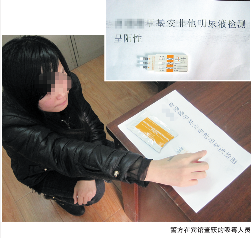
警方在宾馆查获的吸毒人员

20岁左右的年轻男女，白天睡觉夜间在娱乐场所上班，并长期租住宾馆，过着“瘾君子”的生活。昨日，接群众举报，省城瑶海警方一举端掉一伙包住在宾馆的吸毒人员，现场共抓获16名“瘾君子”。