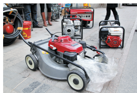
山寨的雅马哈发电机