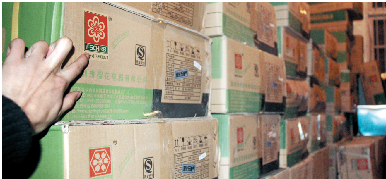
仓库里的山寨“樱花”抽油烟机

乍一看都是“樱花”牌抽油烟机，但仔细分辨却来自好几个“妈”：深圳市樱花电器有限公司、广州樱花电器实业有限公司、樱花电器(香港)实业有限公司……品牌标识各异的“樱花”一时间让记者有些眼花缭乱。昨天下午，记者跟随合肥市工商局瑶海分局捣毁了两个电器仓库，不仅查获了各种“樱花”抽油烟机，还有近百台“三无”抽油烟机，想“扮成”什么品牌都可以。