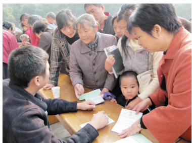
深入小区强化服务

的服务,他们廉洁高效、服务社会、促进发展的工作作风,得到了开发企业和客户的好评。