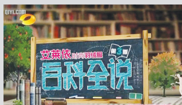
“瑶药泡脚”——走进《湖南卫视》