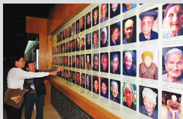
广西巴马瑶族自治县81位百岁寿星