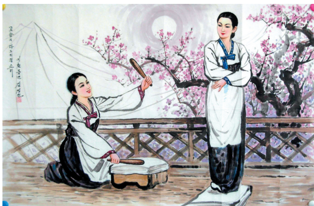
朝鲜国画