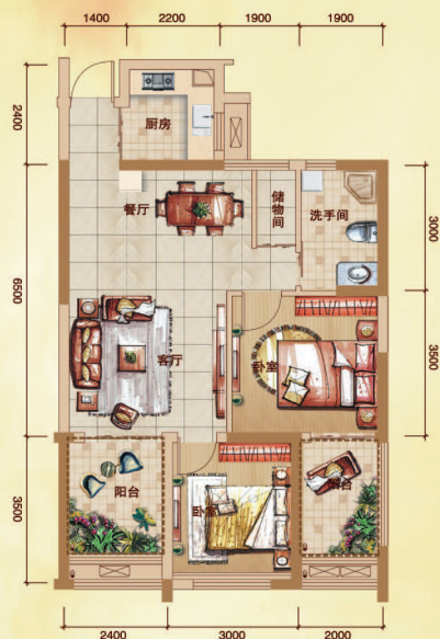
A2 户型 6#楼 建筑面积约:96.33平米 计一半建筑面积 [装修示意图仅供参考]