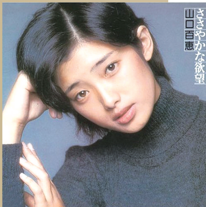
山口百惠 ささやかな欲望