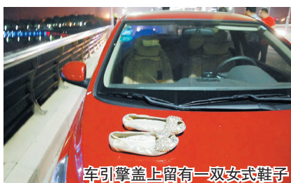
车引擎盖上留有一双女式鞋子