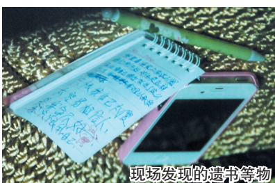
现场发现的遗书等物