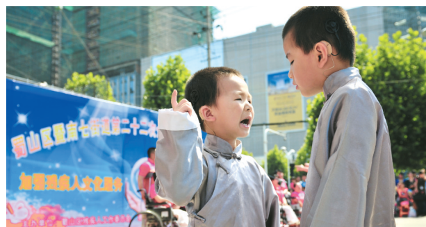
说相声的聋哑“小哥俩”