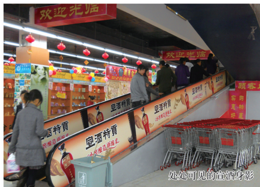
处处可见的宣酒身影

自2009年底进入合肥市场，在短短一年的时间里，宣酒小窖酿造的绵柔品质就得到省城市民的认可与喜爱，成为合肥市场2010年度成长最快的白酒品牌，宣酒也如一枝枝红梅绽放在合肥的每一个角落。2011年，宣酒多年来所积聚的品牌势能开始释放出来，扎实推进的酒店、商超等销售渠道也呈现出销售快速增长的强劲势头，各类名烟名酒店的宣酒陈列随处可见。2012年春节至今，宣酒销售出现“井喷”，部分产品一度脱销。