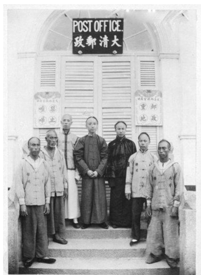
大清邮政工作人员

晚清的中国社会风云变幻，洋人、洋货纷纷涌入，涤荡着人们的思想。下面几张老照片，拍于上世纪最初和上上世紀末，从中可见当时的地理、民俗与社会风情。