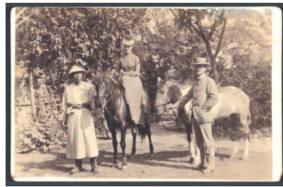
1892年在北京的外国夫妇

骑石马”。后来每逢闰月，清溪村打目连，村人都要到“石马”前烧香祭祀一番，然后才回村开演目连戏。这个代代相传的故事从一个侧面反映了郑之珍从小痴迷读书。