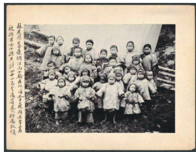
1904年，解救的被拐儿童

昏庸的考官所识。郑之珍没走上仕途，社会少了一个官吏，却多了一个剧作家，于郑之珍本人而言，他入仕济世的理想不能实现，甚至生活还得靠做生意的兄弟们的接济，但对于传统文化而言，却是一大事幸事。