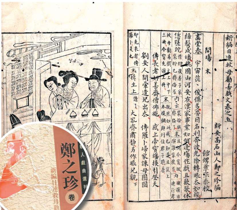
手抄及黄山书社出版的郑之珍目连戏剧本

几百年来，目连戏以其博大纷繁的戏剧形式、无所不包的表演手段、积淀深厚的音乐素材及情景交融、观演互动的演出排场，在民间盛演不衰，一度广泛流布于安徽、江苏、浙江、江西、湖北、湖南、四川、山西、福建、河南等地。然而，发展到明代，目连戏版本芜杂，没有完整的总体结构框架，这就要求目连戏要有完善的演出剧本，用以统一形制，规范演出。于是，目连戏集大成者郑之珍应运而生。