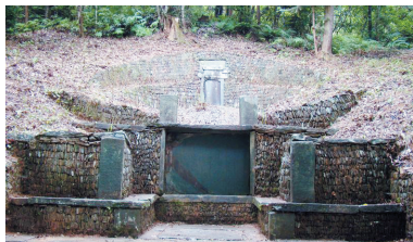
省级文保单位郑之珍墓

溪村西北乌株山圣堂坞的墓葬，规格雄伟，1989年5月公布为第三批省级重点文物保护单位。尤其是郑之珍女婿叶宗泰写的墓志铭，清晰地写明了郑之珍的生平，他是祁门县一个秀才，后人称他为高石公。