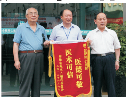
安徽省残疾人福利基金会主席给合肥同仁医院授锦旗