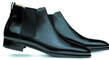
布莱尔最喜欢穿黑色矮帮带扣皮鞋