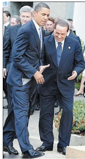
贝卢斯科尼喜欢穿平尖便鞋