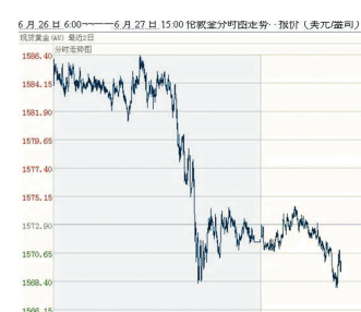
6月26日6:00-6月27日15:00伦敦金分时图走势 报价(美元/盎司)

因西班牙国债收益率上涨，金价微跌。至27日15:00点，最高1586.7，最低1567.8，