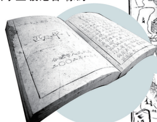
古时候的“西平门”大约在此位置