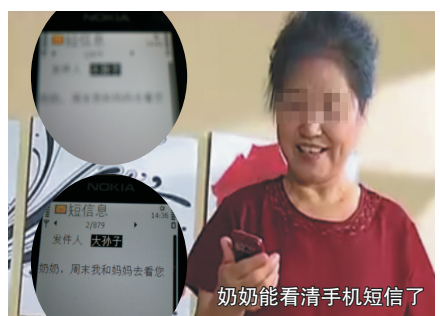
奶奶能看清手机短信了

页都能找到他的名字。其代代相传的优视除障方,以独特性的体液排毒理论拯救上百万患者,凡视物模糊、眼蒙白雾者,无论症状轻重、时间长短,一服就看清,三服药就能康复。30年前经他治疗的百岁诸多老人,至今视力良好,甚至穿针引线,堪称奇迹!