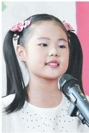
参赛小朋友在比赛现场