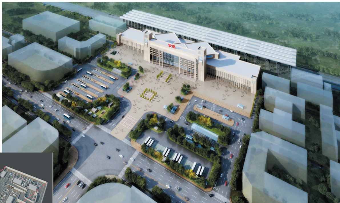
地面广场层方案设计效果图

不过,随着合肥轨道交通1号线的开建,困扰该市多年的这座广场也即将迎来“解脱”般的改造。未来,除了下火车的乘客可从地下出站,并直接在地下换乘地铁、出租车以及私家车之外,多达3层的停车场也绝对够你用了。