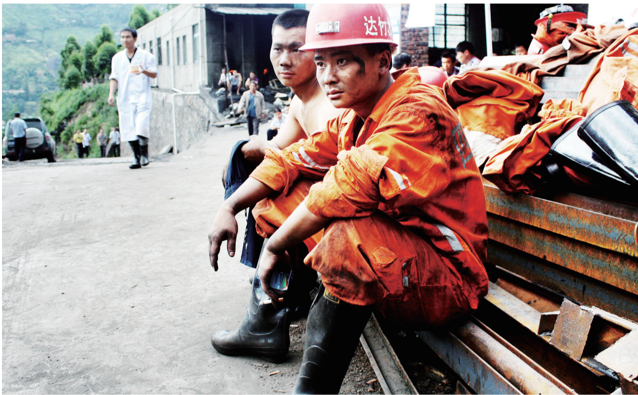
疲惫的救护人员在休息

据新华社电 肖家湾矿难遇难人数升至43人 最后3名被困者位置已经锁定。9月1日,四川省达州市达竹煤电救护队队员结束逾13小时搜救工作,返回地面休息。