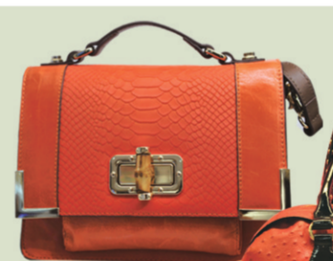
▲Le Saunda橙色蛇纹女包 参考价格:1498元