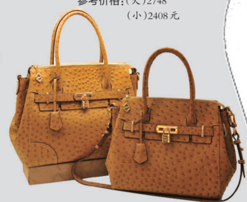
▼威尔萨斯黄色鸵鸟纹女包 参考价格:(大)2748 (小)2408元