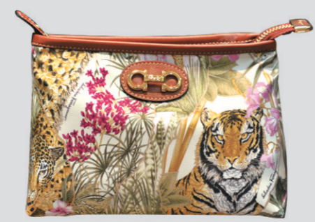
▲Ferragamo老虎印花手包 参考价格:2150元