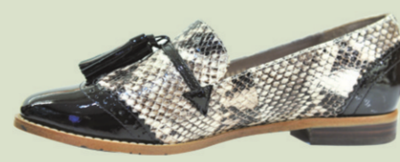
▼Le Saunda斑马纹低跟休闲皮鞋 参考价格:1298元