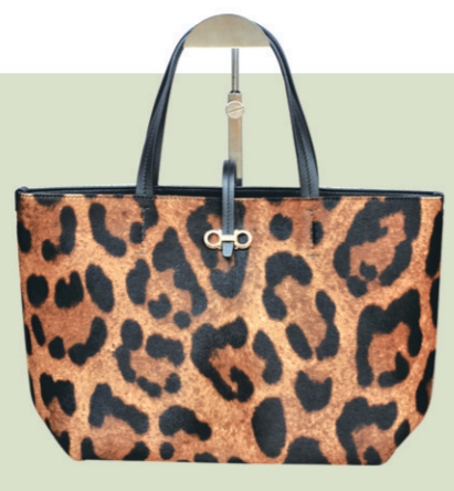
▲Ferragamo豹纹手提包 参考价格:8682元