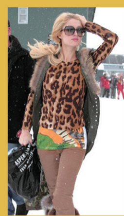
Paris Hilton 还有谁比她能更hold住豹纹的么,好一只婀娜的豹女郎