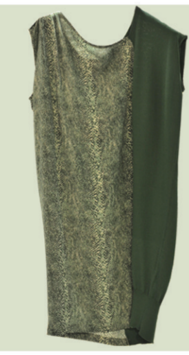
◀mia mia墨绿长款蛇纹拼接上衣 参考价格:1090元