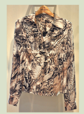
▲孜姿豹纹衬衣 参考价格:980元