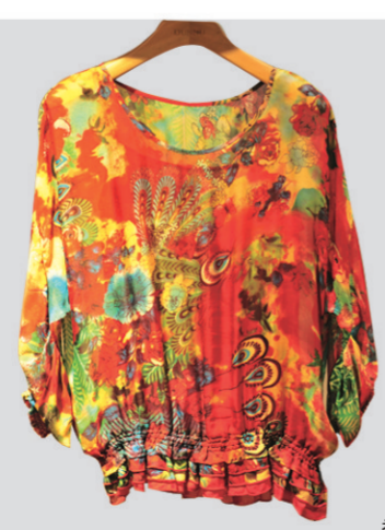
◀敦奴凤凰印花上衣 参考价格:1550元