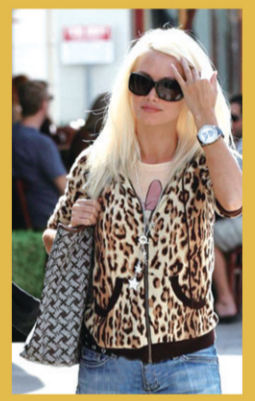
Holly Madison 豹纹上衣和牛仔长裤,将野性和休闲完美结合起来