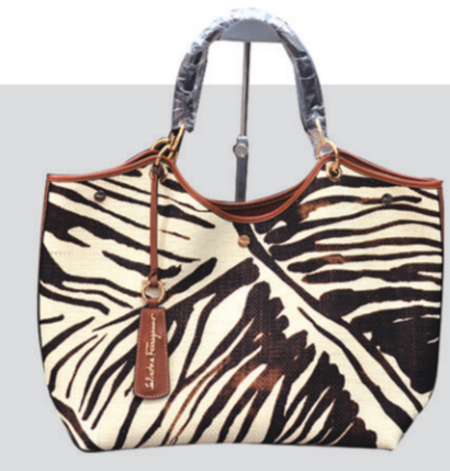
▲Ferragamo斑马纹女包 参考价格:8120元