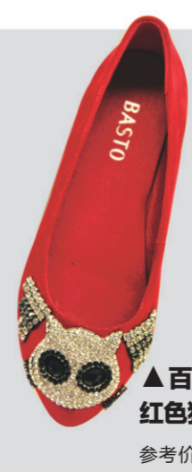
▲百思图红色猫头鹰女鞋 参考价格:258元