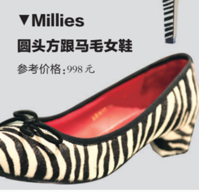
▼Millies圆头方跟马毛女鞋 参考价格:998元