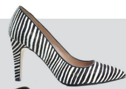
▲Le Saunda斑马纹尖头高跟鞋 参考价格:1298元