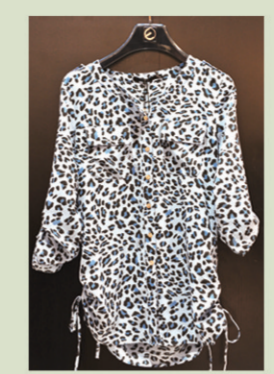
▲Theme蓝色豹纹衬衫 参考价格:598元