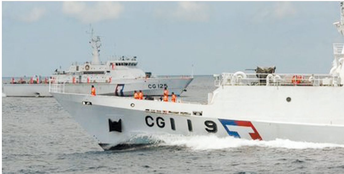
台海巡舰艇赴钓鱼岛海域进行操演