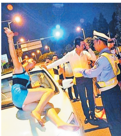
“醉酒海归女”拿着遥控器坐在车盖上

记者注意到，整段视频中汽车的商标非常明显，还大量充斥着“高科技”的字样，因此不少网友质疑，这可能是汽车厂商进行的炒作。至于“醉酒海归女”这种行为是否属于酒后驾驶，众网友几乎一致认为，遥控驾驶也是驾驶，所以同样属于酒驾。