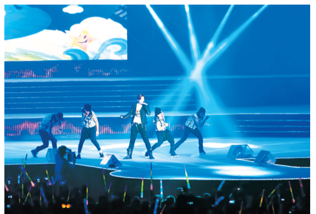
罗志祥劲歌热舞让全场尖叫声不断