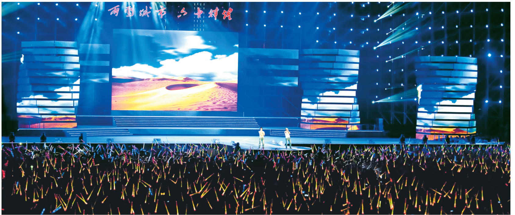
开幕式文艺演出现场