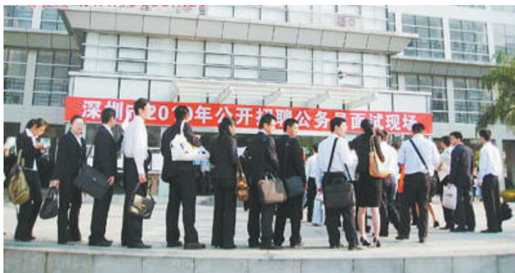
深圳公务员招考面试现场(资料图片)

正在进行的深圳市机关公务员招考面试计分出现失误,因电脑程序出错,参加面试的685名考生拿到的面试成绩均少计一项分数。经过连夜的补救,27日上午,重新核准后的分数发放到考生手中,部分考生因联系不上暂未拿到。深圳市委组织部、市考试院当天专门向考生作出说明,并公开道歉。 星报综合